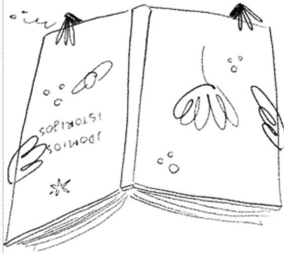
Varna Vanilė nekantravo, o Žvirblis Pipiras tebeskaitė.

– Pavėluosime J Joninių šventė! – skubino Vanilė. – Tu skrisk, aš iš paskos. Tik šį puslapį pabaigsiu. Vanilė atsiduso ir nuskrido. Joninės buvo puikios. Visi šoko, dainavo iki užkimo. Kai sutemo, uždegė laužą.